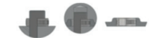
Montage durch Einspritzen

Durch das spezielle Design und die Geometrie der FASTEKS® Compression limiters wird sichergestellt, dass unter diesen Bedingungen eine Kompression von weniger als 1% der Gesamtlänge der Kompressionsbegrenzer vorhanden ist.